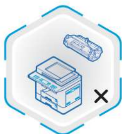
عدم مکش پودر تونر

* حداکثر میزان گرمای محیط این دستگاه ۴۰ درجه است. * در صورت واژگون شدن دستگاه ابتدا آن را از برق شهری جدا کرده و سپس دستگاه را جابجا نمایید. * در زمان انبار نمودن، دستگاه را در مکان صاف و سر پوشیده و بدون رطوبت نگهداری کنید. * از شستن بدنه بالای دستگاه خودداری نمایید. * تعمیر و تعویض قطعات دستگاه حتماً باید توسط افراد متخصص انجام شود و در صورت نیاز به تعویض قطعه حتماً بایستی از نوع اصل (سفارش شده توسط سازنده) استفاده شود. * کمپانی تولید کننده و نمایندگی آن در صورت مشاهده مواردی که نشان دهنده عدم رعایت موارد فوق باشد هیچ گونه مسئولیتی را نمی پذیرد و در صورت بروز حادثه مسئولیت آن برعهده خریدار می باشد. * در صورتیکه کف یا مایع از ماشین خارج گردد، بلافاصله کلید را خاموش کنید.