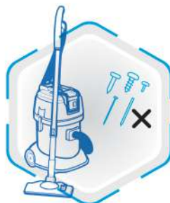
عدم مکش اجسام تیز و بُرنده