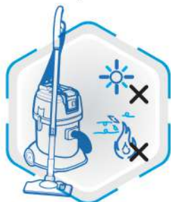
عدم قرار گیری در معرض حرارت و آفتاب