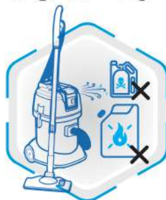
عدم مکش مواد مشتعل و سمی