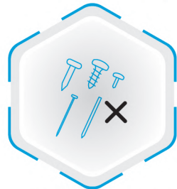
عدم مکش اجسام تیز و بُرنده