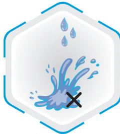
عدم مکش مایعات