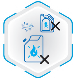
عدم مکش مواد مشتعل و سمی