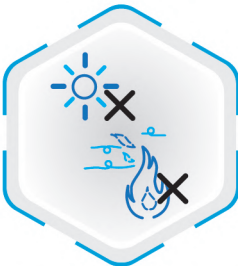
عدم قرار گیری در معرض حرارت و آفتاب